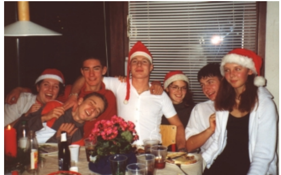
En samling glade ungdomsroere til julefrokost

Lørdag den 9.12 holdt vi julefrokost. Vi var 28. Festudvalget havde uddelegeret hvad vi hver især skulle have med af madretter, og vi fik som vi plejer, alt for meget at spise. Vi havde hver en pakke med som vi spillede terninger om, og rendte