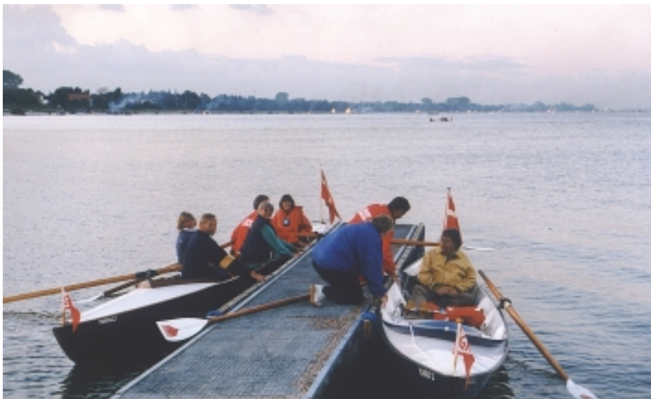
Fra sankthansaften: Så er vi klar til at ro ud og se på sankthans bål. Den ene båd nåede dog ikke særlig langt.